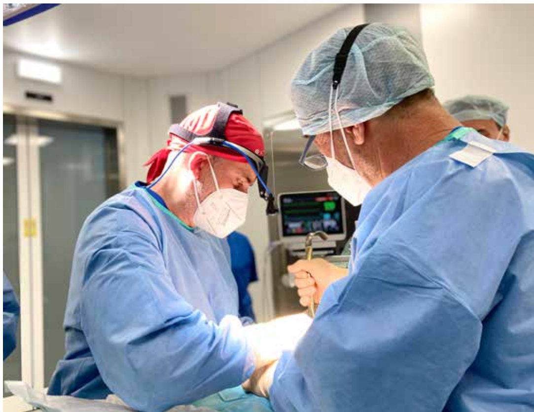
Sala operatoria, équipe chirurgica e staff infermieristico.