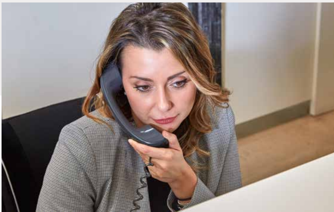
Staff di Segreteria