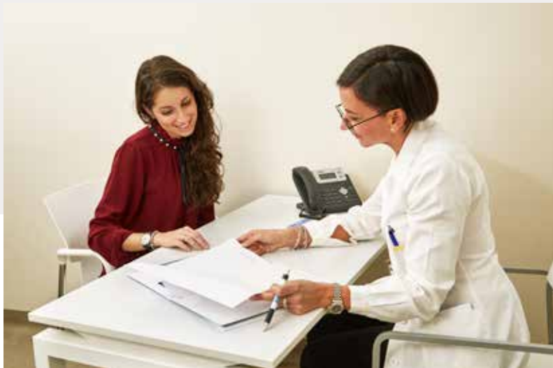
Ambulatori per eseguire valutazioni e visite di controllo; gli appuntamenti sono gestiti dalla segreteria.